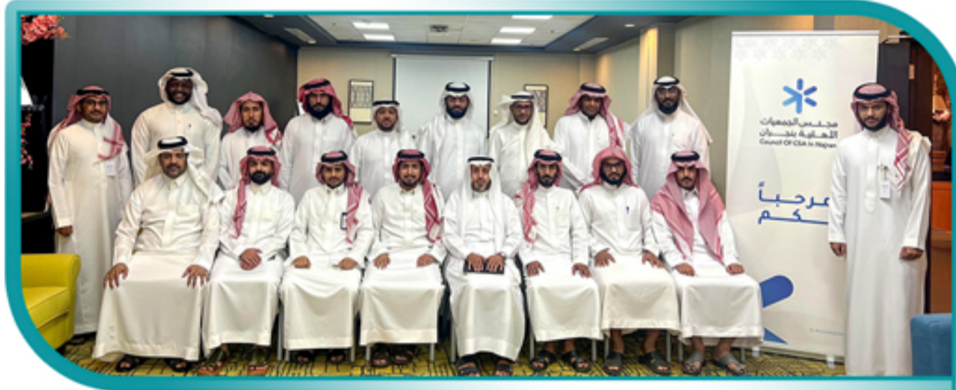
مشاركة الجمعية لقاء الجمعيات العاملة مع الشباب برعاية مجلس الجمعيات الأهلية بمنطقة نجران