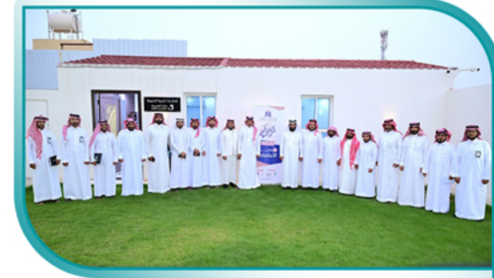
مشاركة الجمعية في دورة الاستثمار الاجتماعي