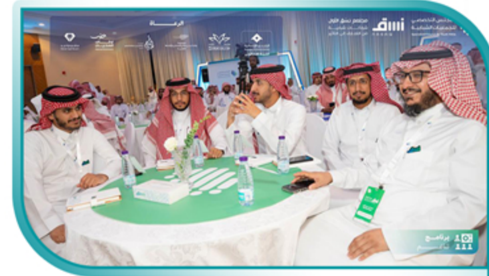
مشاركة الجمعية في ملتقى نسق الأول برعاية كريمة من المجلس التخصصي للجمعيات الشبابية

مشاركة وحدة التطوع بالجمعية في تنظيم لقاء ركائز الاستقرار الاسري والذي نفذته جمعية رؤى النسائية